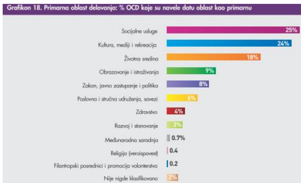
Grafikon 3, preuzet iz (Velat, 2011: 24)

pre 1989. godine (45%), one koje imaju od 11 do 20 aktivnih ljudi (33%), s budžetom od 20.001 do 100.000 evra (34%), kao i OCD iz zapadne Srbije (33%). U najvećoj meri se kulturom, medijima i rekreacijom bave sasvim nove organizacije, nastale posle 2010. godine (26%), s najviše petoro aktivnih ljudi (27%), organizacije sa sasvim malim budžetima (do 1.000 evra, 28%) i one iz Vojvodine (28%). Životnom sredinom se bave najviše sasvim mlade organizacije koje su nastale od 2010. godine (24%), s do petoro aktivnih ljudi (22%), bez budžeta (26%), iz istočne Srbije (30%) (Velat, 2011: 24). Iz ovih podataka vidimo svu širinu i raznolikost civilnog društva u Srbiji. Sledi grafički prikaz OCD sa njihovim primarnim oblastima delovanja.